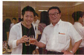
▲楽しい会になりました。