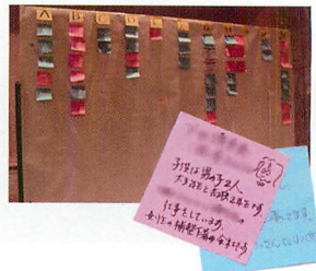
▲受付時に付箋を渡し、近況を書いてもらいました。

会場はホテルにお任せしてありましたが、音響、食事、ドリンクなどは幹事がすることはありませんでしたが、受付、司会、会計を担い、歓談の時には在校当時の写真を集めたスライドショーを、また、当時の懐メロをBGMとして編集したものを流し、当日の写真も幹事が撮りました。また、撮った写真は後日名札の裏に今回のために立ち上げた Web アドレスに掲載、予算があったので、参加者全員に集合写真を発送しました。