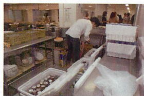
▲飲料の準備をする役員。保冷などの準備も必要です。

ただ、素人が全て運営したことにより至らない部分も多く、片づけをご参加頂いた先生方にも手伝って頂くなど、課題も残る同期会でした。次の機会には直前準備～片付けまでのシミュレーションは徹底したいです。